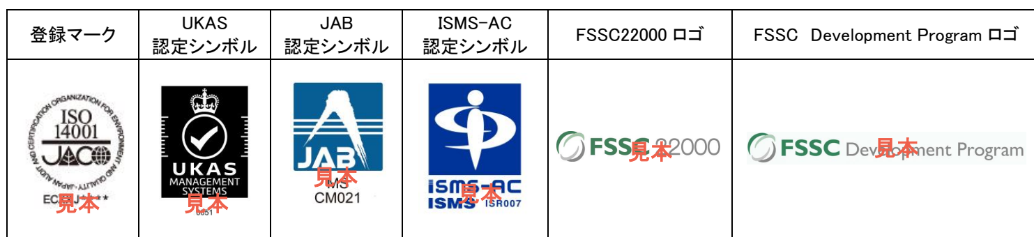
図 1 登録マークと認定シンボル等の例